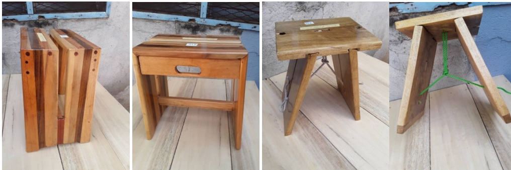
De kruk model masters meubelbedrijven

De jury bestond uit: de bazin van een naaiatelier, leraar van de school, en een lid van het bestuur van Lifestyle. Helaas konden wij , het HBS bestuur, niet als mede juryleden fungeren zoals het voorgaande jaar omdat het onmogelijk was om via foto's de kwaliteit van de krukjes te kunnen beoordelen.