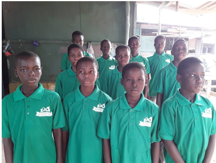
de 1 e jaars timmerleerlingen 2020