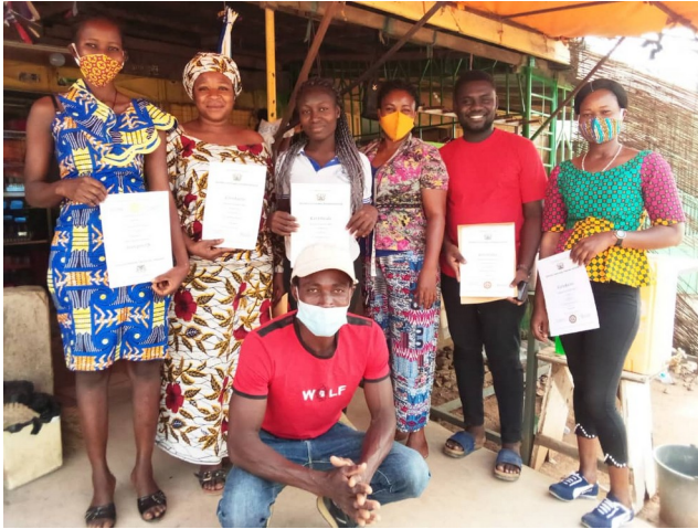
De geslaagden van de kleermakers